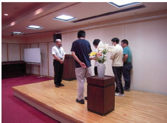
写真① 感謝状贈呈式の様子

日本福祉大学高浜専門学校の閉校に伴い同専門学校様より、書籍・掃除道具一式・作業机・バスタオル等々多くの物品を寄贈していただきました。チャレンジサポートたかはまでは感謝の気持ちを込めて感謝状を贈りました。写真①