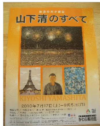
写真② 山下清のすべて